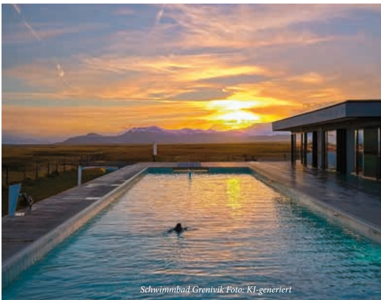
Schwimmbad Grenivik Foto: KI-generiert

Ein typischer Schwimmbadbesuch verläuft für uns eingefleischte Islandtouristen so: Be-